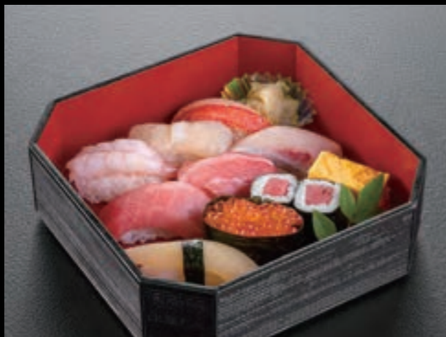
21141 御導師様握り寿司 3,000円 (税込3,300円)