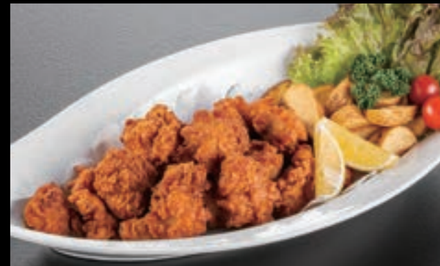
21411 唐揚げポテト 4,200円 (税込4,620円)