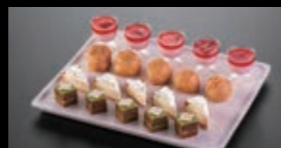
洋デザートセット 21630 〈12P〉 3,000円(税込3,300円) 21631 〈16P〉 4,000円(税込4,400円) 21632 〈20P〉 5,000円(税込5,500円)