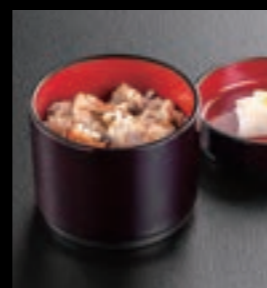
21623 炊き込みご飯 150円(税込165円)

変更いただく際、ご注文の懐石弁当全てに適用いたします。お寿司への変更の際はお新香は付きませんのでご了承下さい。