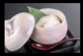
21616 こだわり 手作り豆腐 400円(税込440円)