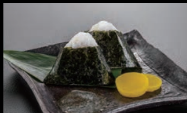
21612 おにぎり2個 400円 (税込440円)