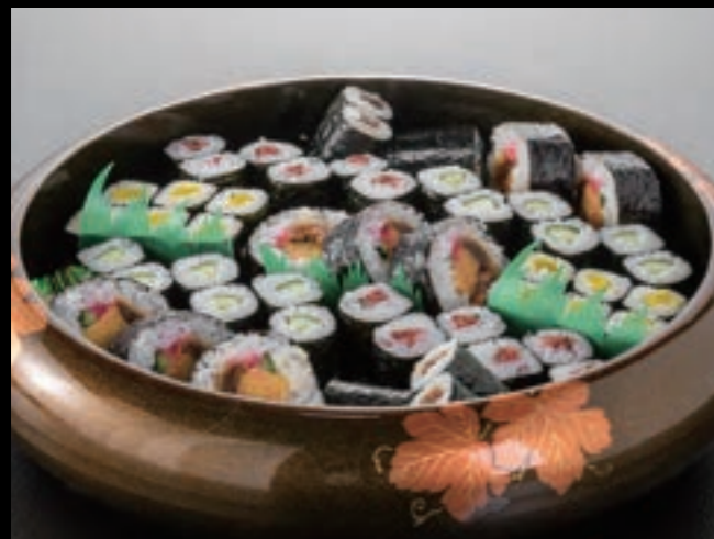
21131 巻き寿司〈3人盛〉 4,500円 (税込4,950円)