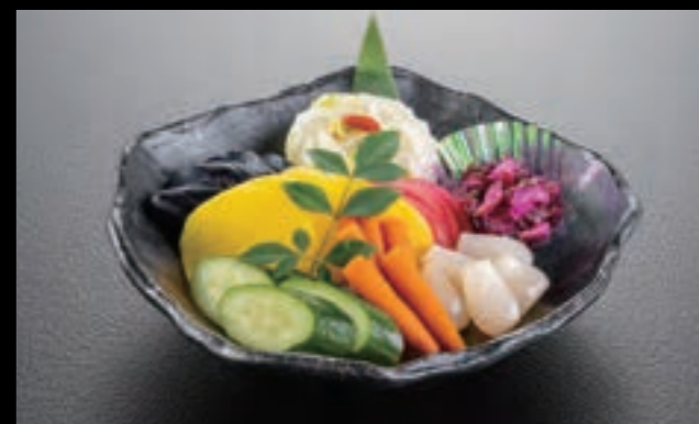
21415 漬物 2,000円 (税込2,200円)