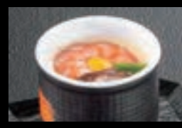
21614 茶碗蒸し 600円(税込660円)

※デザートセットは、季節により内容が異なります。内容のご指定は致しかねます。ご注文は施行日の2日前12時までにお願います。ご注文はセット単位で承ります。