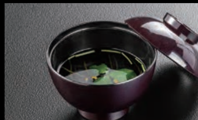
21615 吸物 300円 (税込330円)