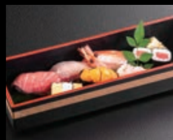
21622 握り寿司(特上) 2,000円(税込2,200円)