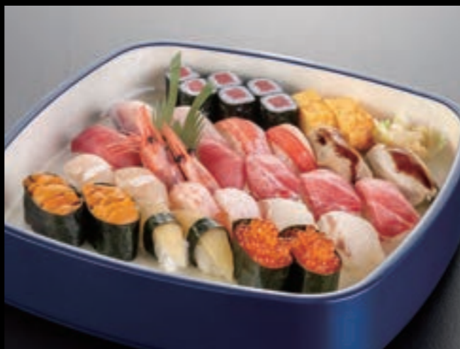
21102 特上握り寿司〈3人盛〉 9,000円 (税込9,900円)