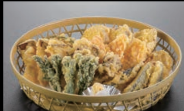
21331 野菜天ぷら〈3人盛〉 4,200円 (税込4,620円)