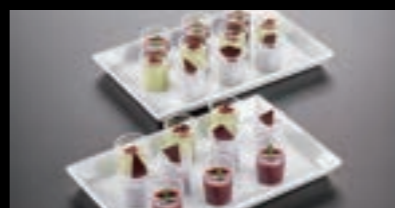
和デザートセット 21633 〈12P〉 3,000円(税込3,300円) 21634 〈16P〉 4,000円(税込4,400円) 21635 〈20P〉 5,000円(税込5,500円)