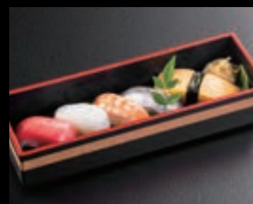
21620 握り寿司(並) 1,000円(税込1,100円)

〈変更オプション〉 ◆ご飯はお寿司・炊き込みご飯へ変更できます ★変更オプションは懐石弁当専用となります。