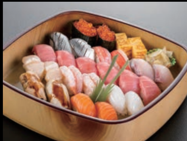
21103 上握り寿司〈3人盛〉 7,500円 (税込8,250円)