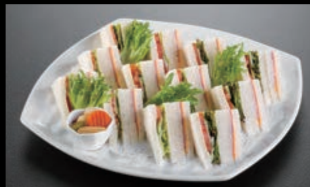
21418 ミックスサンド 3,600円 (税込3,960円)