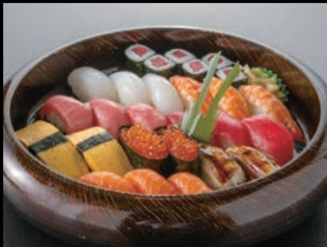
21104 握り寿司〈3人盛〉 6,000円 (税込6,600円)