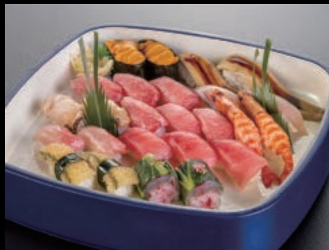
21101 極上握り寿司〈3人盛〉 12,000円 (税込13,200円)