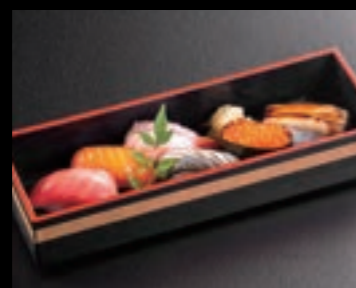
21621 握り寿司(上) 1,500円(税込1,650円)