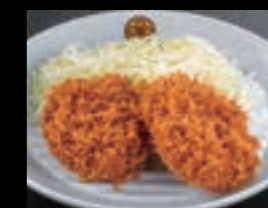
21624 「黒豚ヒレ」使用 一口かつ 2個 800円(税込880円)