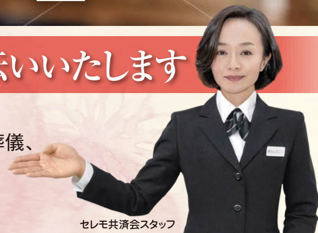
セレモ共済会スタッフ

「セレモ共済会」では、小規模で温かな葬儀から社葬などの大規模な葬儀、 そしていろいろな宗教など、組合員の様々なご要望に寄り添い、 お葬式をお手伝いしています。