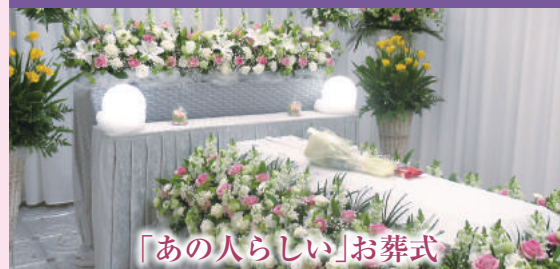
「あの人らしい」お葬式

宗教・宗派にとらわれないお葬式のことを「無宗教(自由葬)」といいます。故人の好きだった音楽を流すなど、自由なスタイルでお見送りができます。