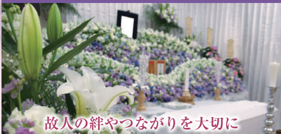
故人の絆やつながりを大切に

参列する方の範囲を定めないお葬式です。参列者の人数は30名から100名ほどが一般的。友人知人だけでなく、仕事でのつながりのある方にも参列いただけます。