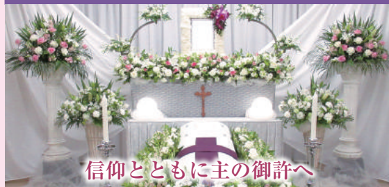
信仰とともに主の御許へ

キリスト教の信仰に基づいたお葬式です。キリスト教はカトリックとプロテスタントに分かれており、それぞれの教えに従った式を行います。