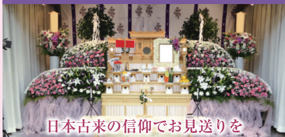
日本古来の信仰でお見送りを

神道では、お葬式のことを「神葬祭」と呼びます。「通夜祭・遷霊祭」、「葬場祭」と2日間で行うのが一般的です。