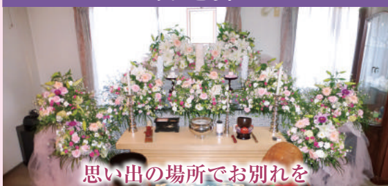
思い出の場所でお別れを

斎場ではなく、ご自宅で行うお葬式です。大人数の参列はむずかしいですが、ご家族と故人の思い出の場所でお別れすることができます。