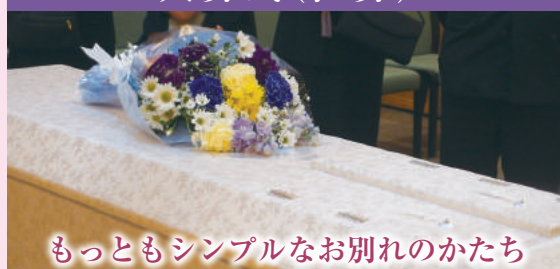
もっともシンプルなお別れのかたち

火葬だけ行うことを「火葬式(直葬)」といいます。費用は抑えられますが、ゆっくりとお別れすることはできません。