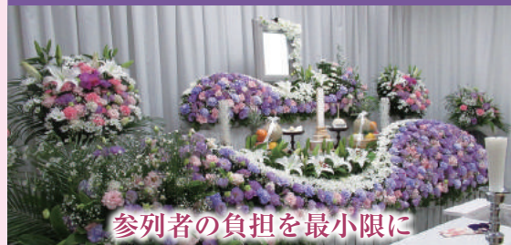
参列者の負担を最小限に

告別式のみのお葬式を、「一日葬」といいます。参列予定の方に遠方から来られる方や高齢の方が多い場合、負担を少なくするために一日葬が選ばれています。