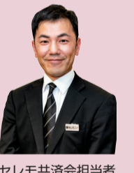
セシモ共済会担当者

お母様のご自宅に近い式場を希望されておりますので、大田区の臨海斎場をご提案いたしました。大田区にお住まいの方は特別料金で利用でき、火葬場併設の斎場ですので、霊柩車を使用する必要がありません。また、祭壇もご家族の意向を汲み、ピンクのお花で製作する小さめの生花祭壇を提案。そしてお亡くなりになった病院から安置場所までの距離も10km以内だったため、セットコースCを提案いたしました。