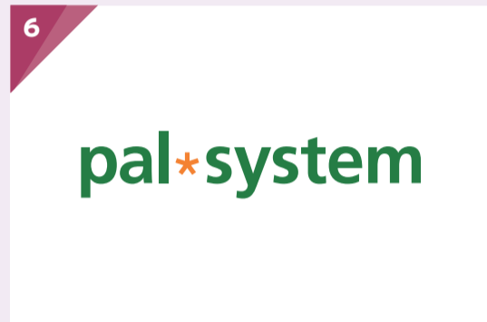
パルシステム指定葬儀社

自社生花部が生花祭壇を製作するため、追加料金を極力頂かずに組合員の皆様の細かなご要望にお応えできます。祭壇の色合いやお花の種類などご相談ください。