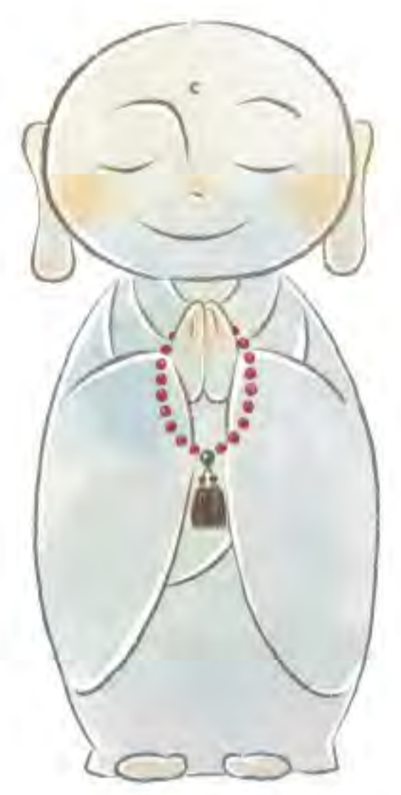
セレモニー オリジナルキャラクター