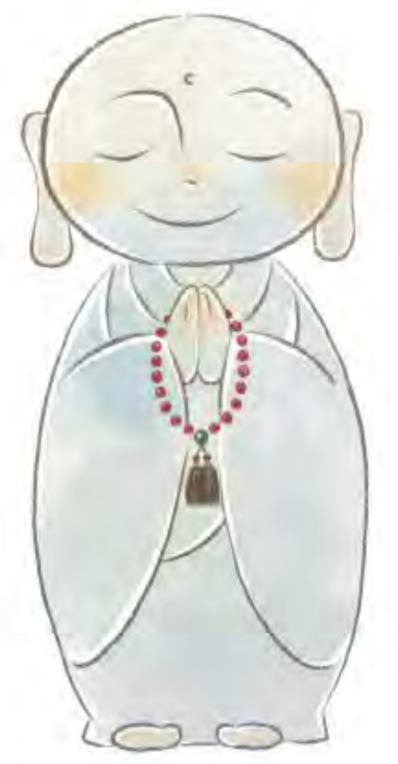
セレモニー オリジナルキャラクター