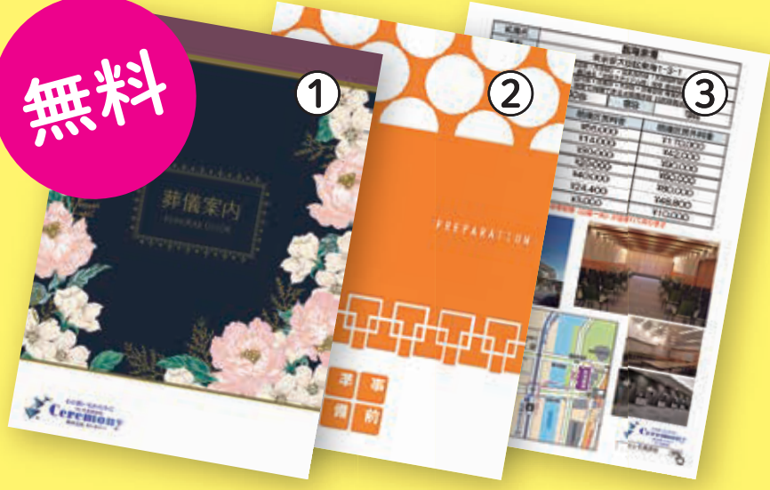
①葬儀案内 ②事前準備 ③式場資料